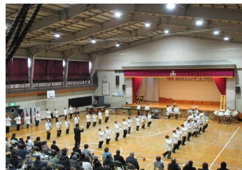
【感動的な演奏に大きな拍手】

2月23日(日)本校体育館で、吹奏楽団たびだちコンサートを開催しました。当日は、寒い中たくさんの児童、保護者、地域の皆様にご来場いただき、今年度の練習の成果を存分に発揮した演奏を行いました。今年度も東北大会金賞受賞の吹奏楽団、上級生が下級生に教え、大勢で心を合わせて音楽を創り上げるという貴重な体験を積み重ねてきました。心のこもった演奏は、聴いてくださる方々の胸に迫るものでした。これまで、吹奏楽団を引っ張ってきた6年生に「ありがとう」を贈りたいと思います。