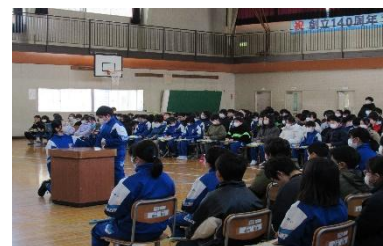
【活発に意見を出し合った児童総会】