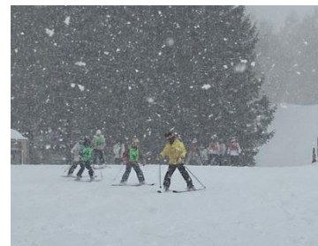
【スキー学習の様子】

1月下旬から2月上旬までの4日間、八幡平パノラマスキー場で3年生から6年生までのスキー教室を行いました。どの学年も1チーム3~5人程度の少人数でスキー学習を行うことができ、充実した1日を過ごしました。それは、のべ113人ものボランティアの指導者の方々にご協力をいただくことができたからです。子どもたちは、学校での練習を経て、当日はさらにステップアップし楽しくすごることができました。