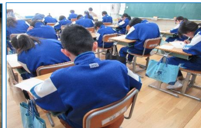
【小学校最後のMT Pに挑む6年生】

1年生の振り返りでは、「テストはたくさんやるほどじょうずに書けるから、自分のみかたみたいです。」と記入していた子がおり、自分が頑張ったことが報われる喜びを感じているようでした。また、学習内容が難しく多岐にわたってくる高学年からは、「分かったつもり、では足りないということが分かった。」「自分の弱いところをもっと復習したい。」などという振り返りもありました。毎日の努力が自分の力につながるということについても気付いた子どもたちでした。