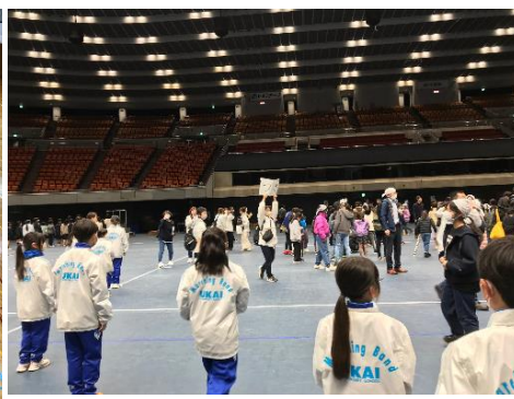
【大阪城ホールでの前日「場当たり」】