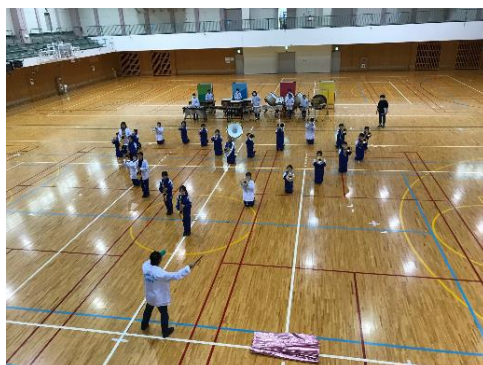
【寝屋川体育館での前日練習】