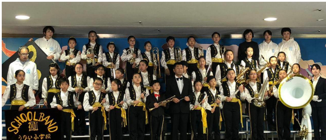
【本番が終わりほっとした表情の団員】